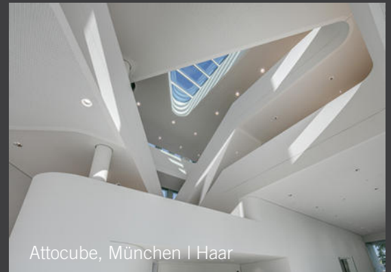
Attocube, München I Haar