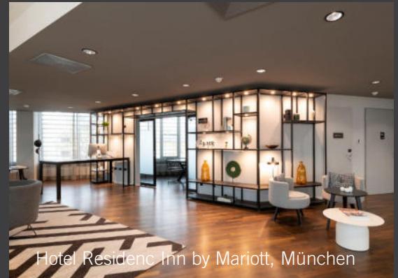
Hotel Residence Inn by Marriott, München

Projekt: Kompetenzzentrum Erziehungsberufe, München Jahr: März 2019 – Mai 2020 Auftragswert: 1.556.000 €