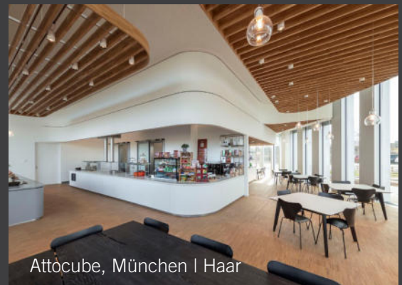
Attocube, München | Haar